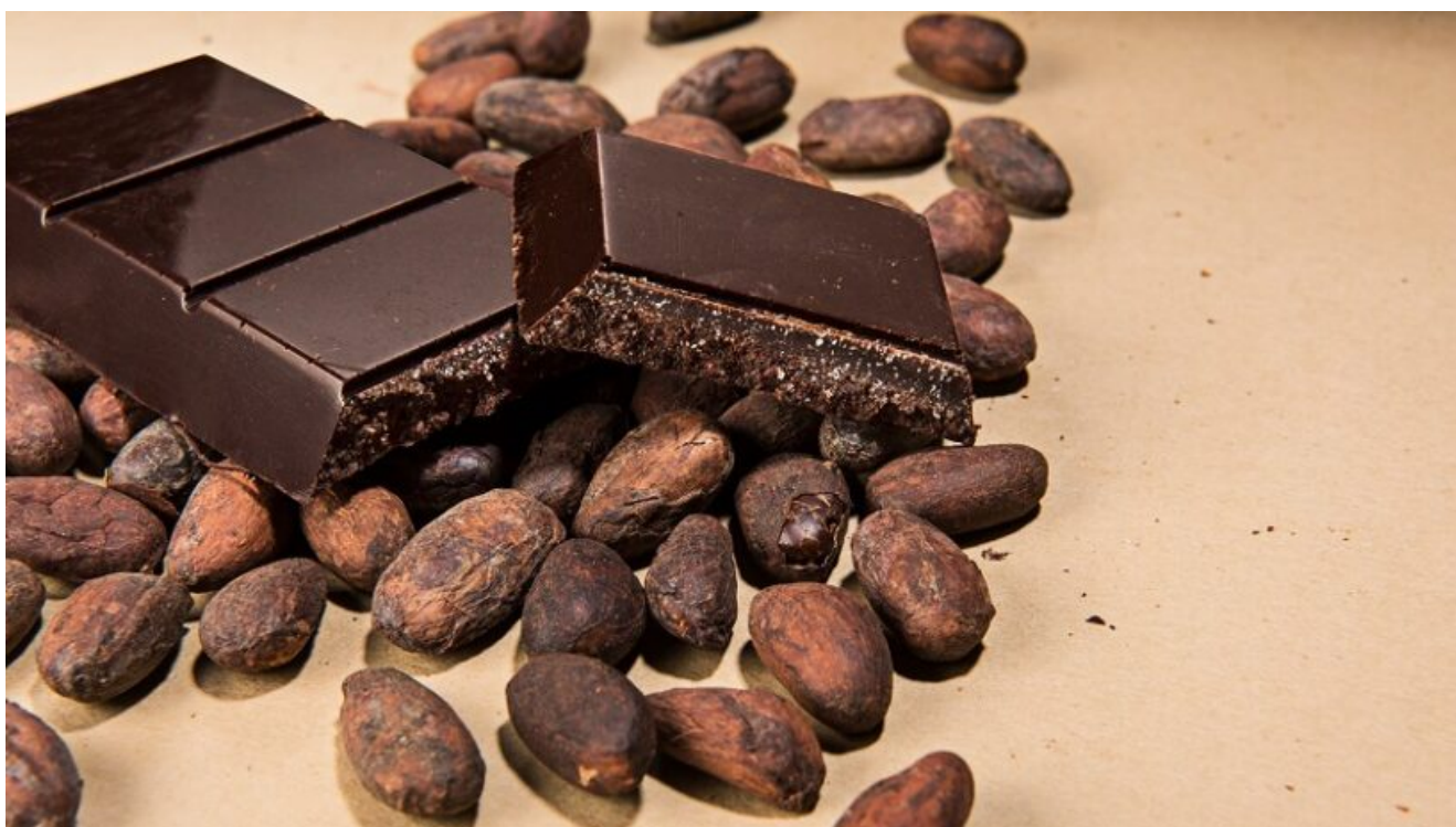
Cioccolato di Modica