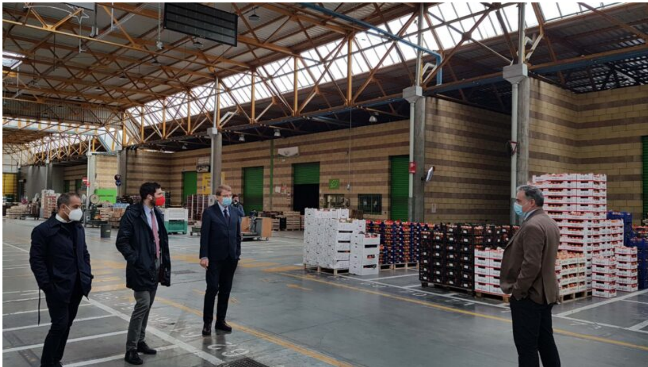
Restyling Mercato Ortofrutticolo Cesena

Interventi interni alla struttura e un grande impianto fotovoltaico: investimento per oltre 1 milione di euro. Riqualficati anche i due accessi a Mercato e Cesena Fiera.