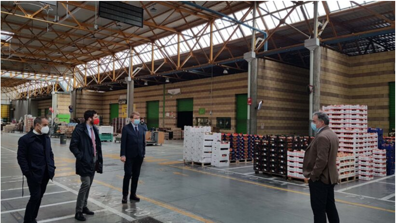
Restyling Mercato Ortofrutticolo Cesena

Interventi interni alla struttura e un grande impianto fotovoltaico: investimento per oltre 1 milione di euro. Riqualficati anche i due accessi a Mercato e Cesena Fiera.