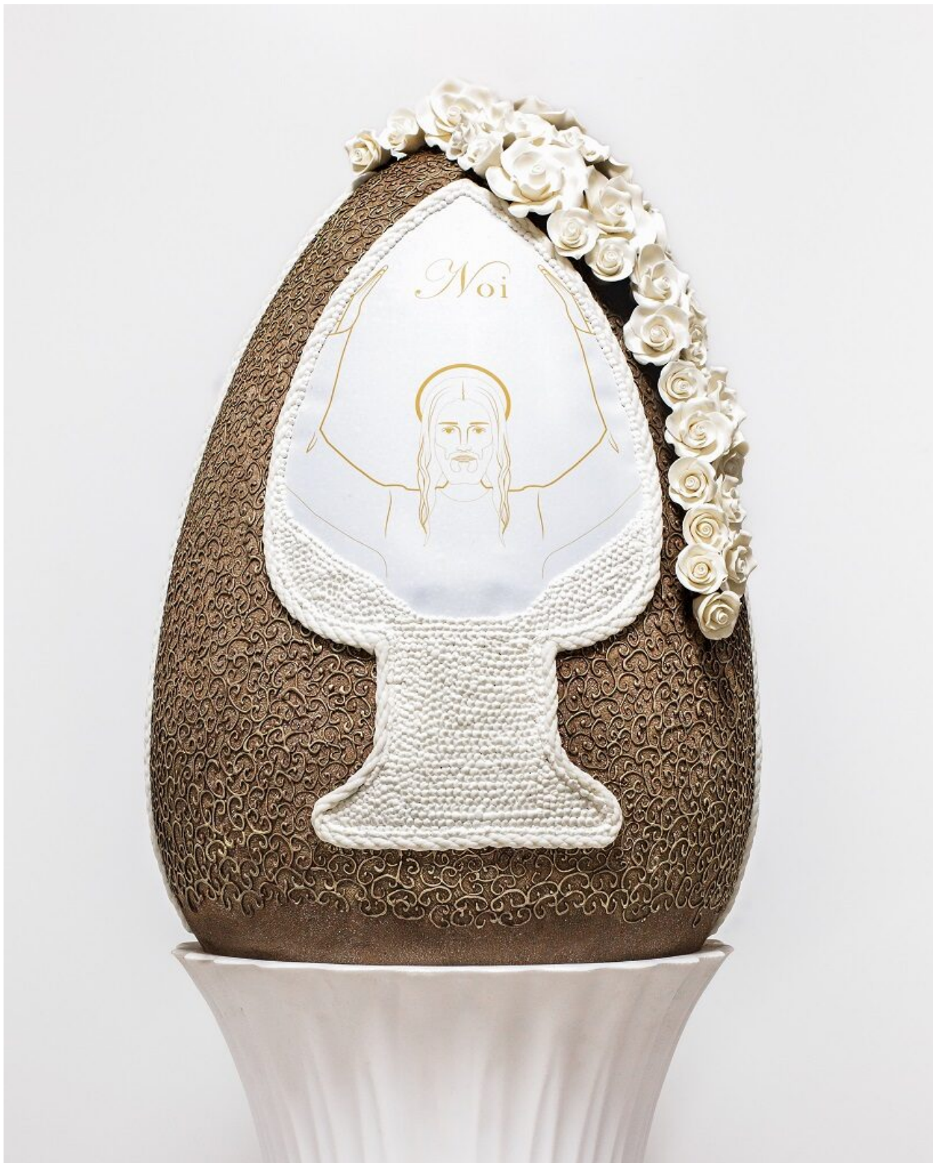
Uovo di cioccolato fondente a base di Cioccolato di Modica IGP