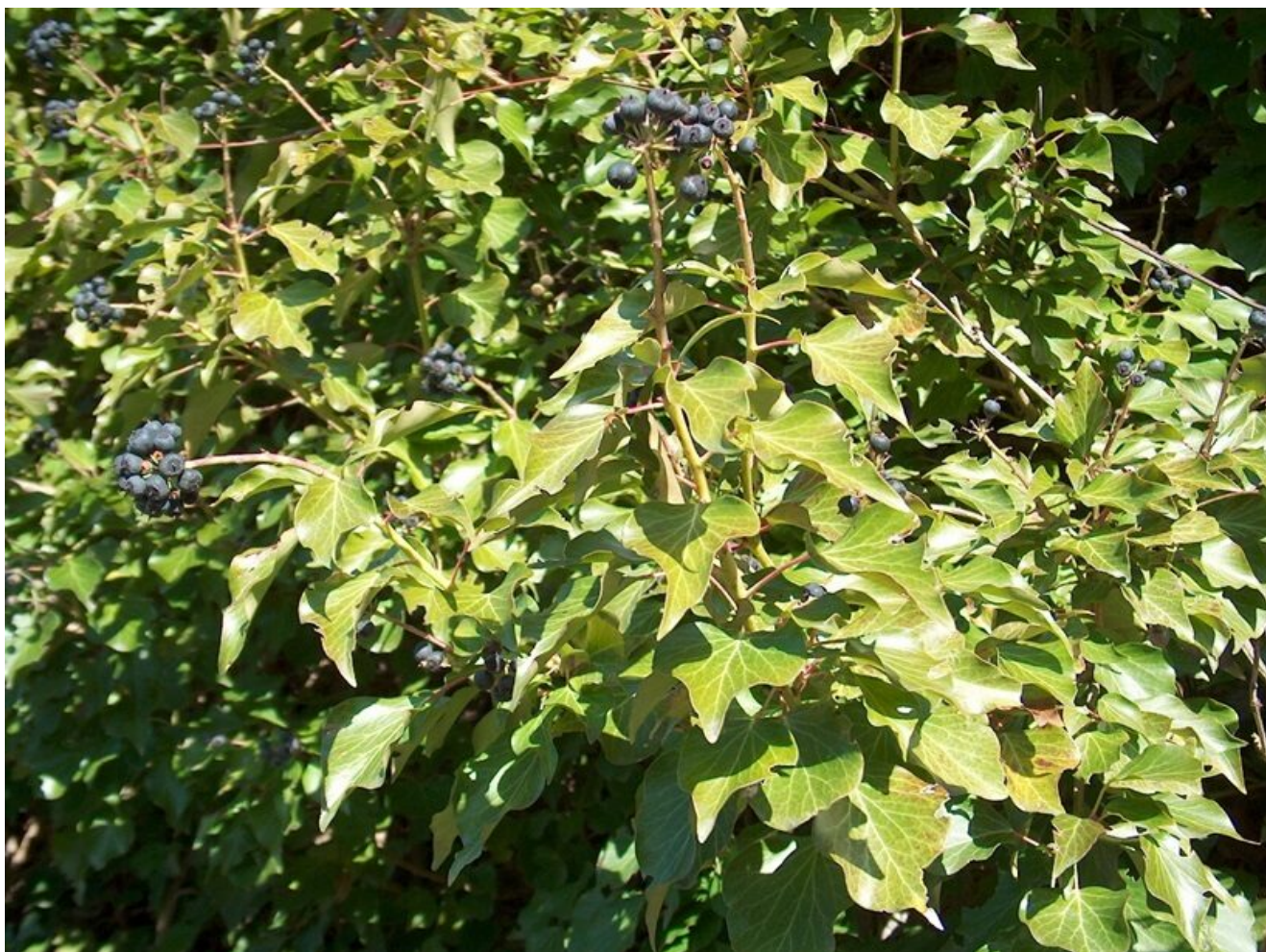
Figura 3. Foglie e bacche di edera

Hedera helix (Figura 3) è una pianta rampicante usata principalmente per il trattamento sintomatologico degli stati febbrili e da raffreddamento.