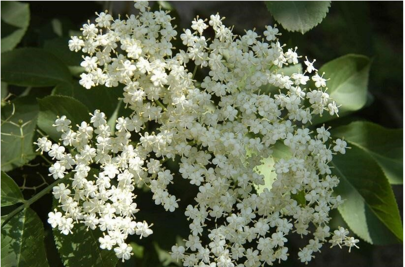
Figura 2. Fiori di Sambuco comune