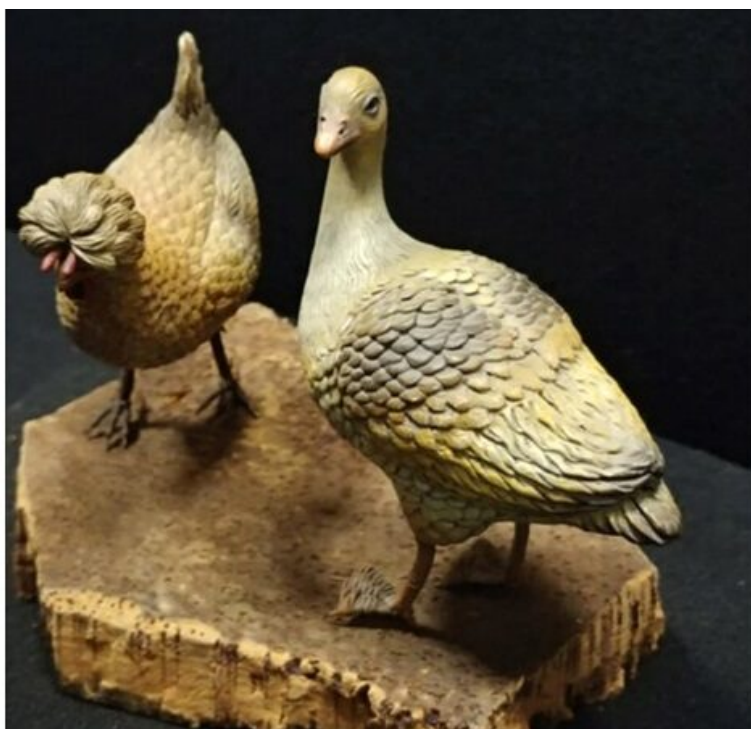
Statuetta di anatra in un presepe settecentesco campano

written by Rivista di Agraria.org | 15 maggio 2024 di Pasquale D'Ancicco