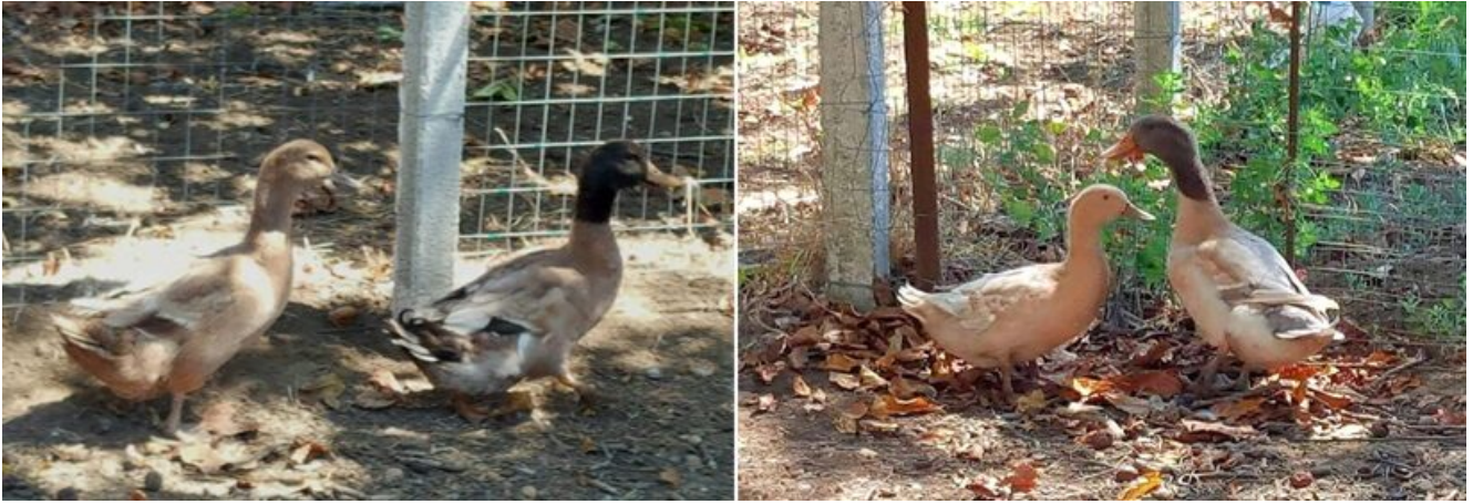
Anatra di Benevento scura – Anatra di Benevento chiara