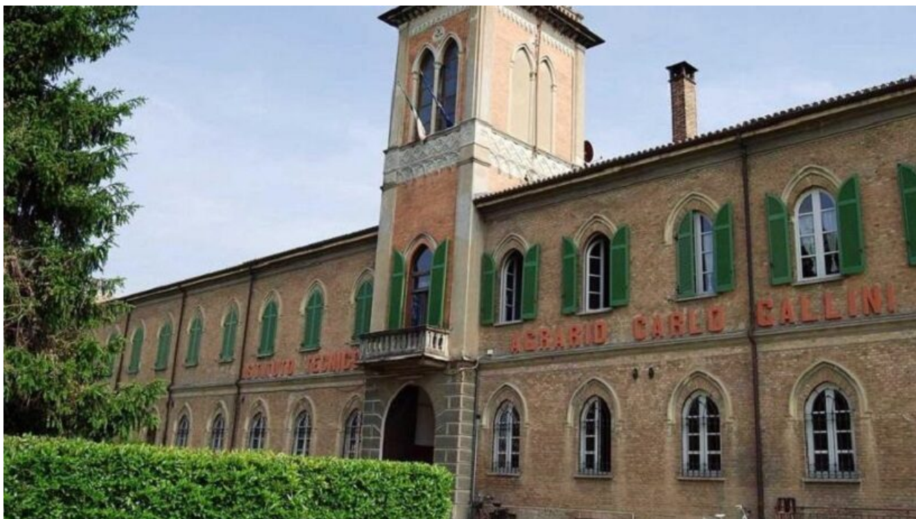
Istituto Tecnico Agrario “Carlo Gallini”

written by Rivista di Agraria.org | 5 aprile 2023