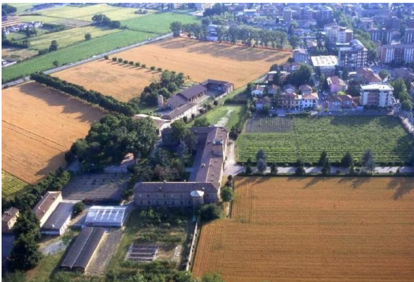
Veduta dall'alto dell'Istituto Tecnico Agrario "Carlo Gallini"

Parallelamente all'arricchimento dell'offerta formativa, un ampio intervento di ristrutturazione dell'edificio scolastico si è concluso nel 2011.