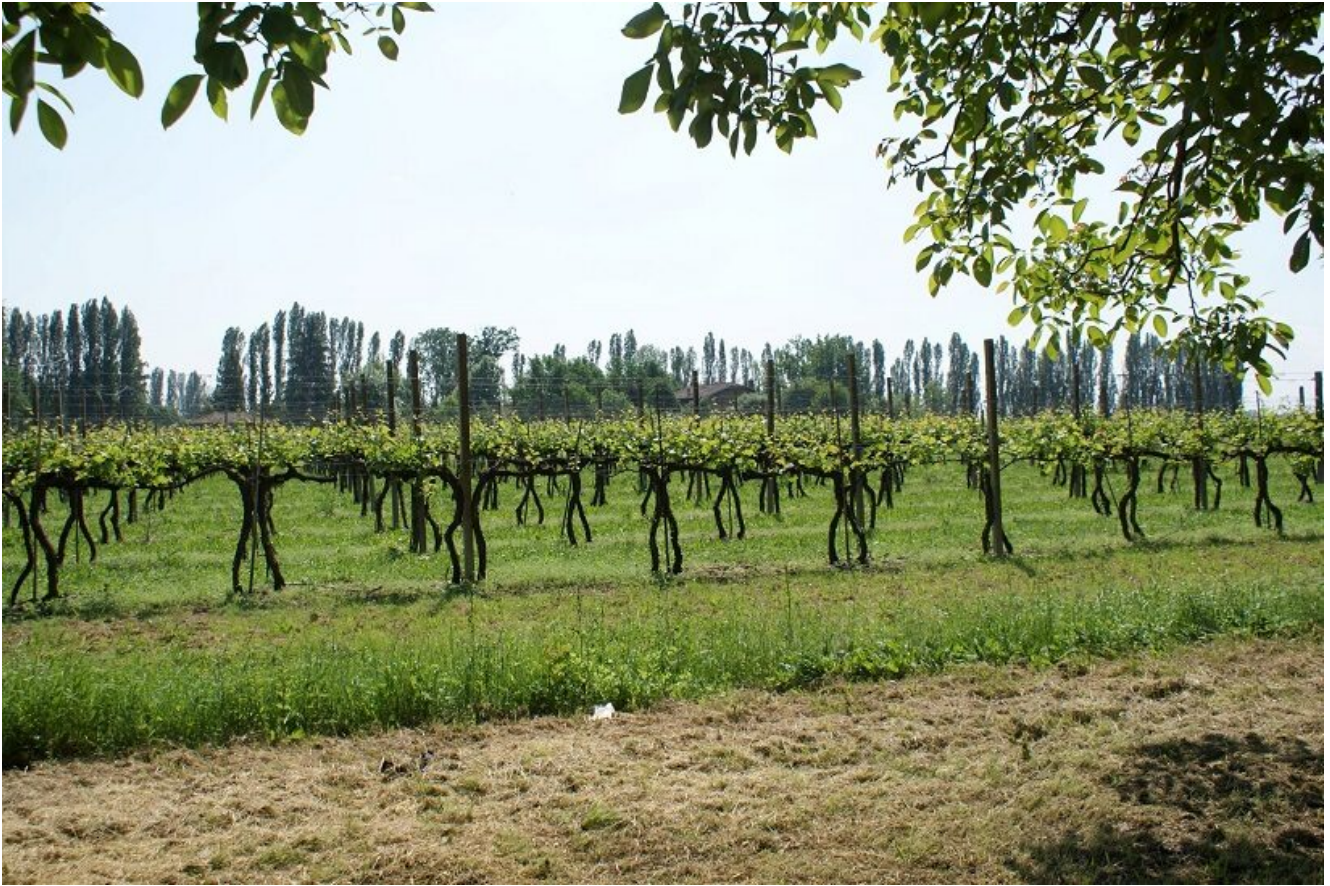
Vigneto dell'azienda Gaggio di Piano