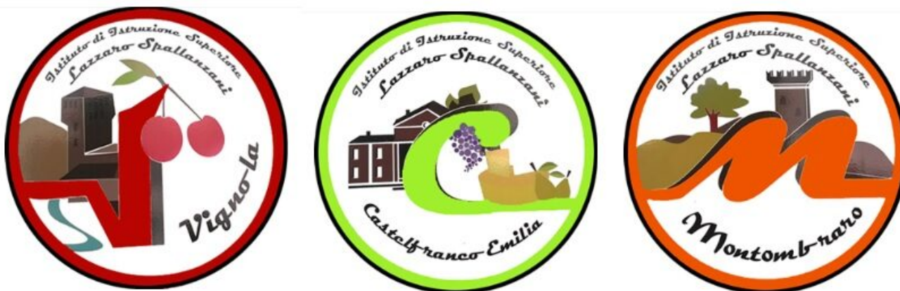
Sedi dell'IIS "Lazzaro Spallanzani"