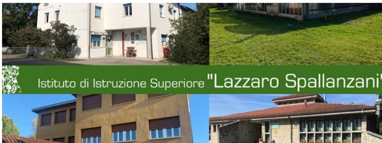
IIS “Lazzaro Spallanzani”

written by Rivista di Agraria.org | 30 novembre 2023