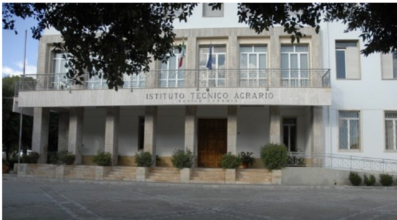
Istituto Tecnico Agrario "Basile-Caramia" - Locorotondo

Dall'anno scolastico 1996 - 1997 l'Istituto è stato accorpato sotto gli aspetti dirigenziali e di coordinamento amministrativo all'Istituto Tecnico Agrario "F. Gigante" di Alberobello. Dal 2001 le due sedi sono state accomunate sotto l'unico nome di ISTITUTO TECNICO AGRARIO STATALE "B. CARAMIA" - "F. GIGANTE" con ordinamento speciale per la viticoltura ed enologia - Locorotondo - Alberobello.