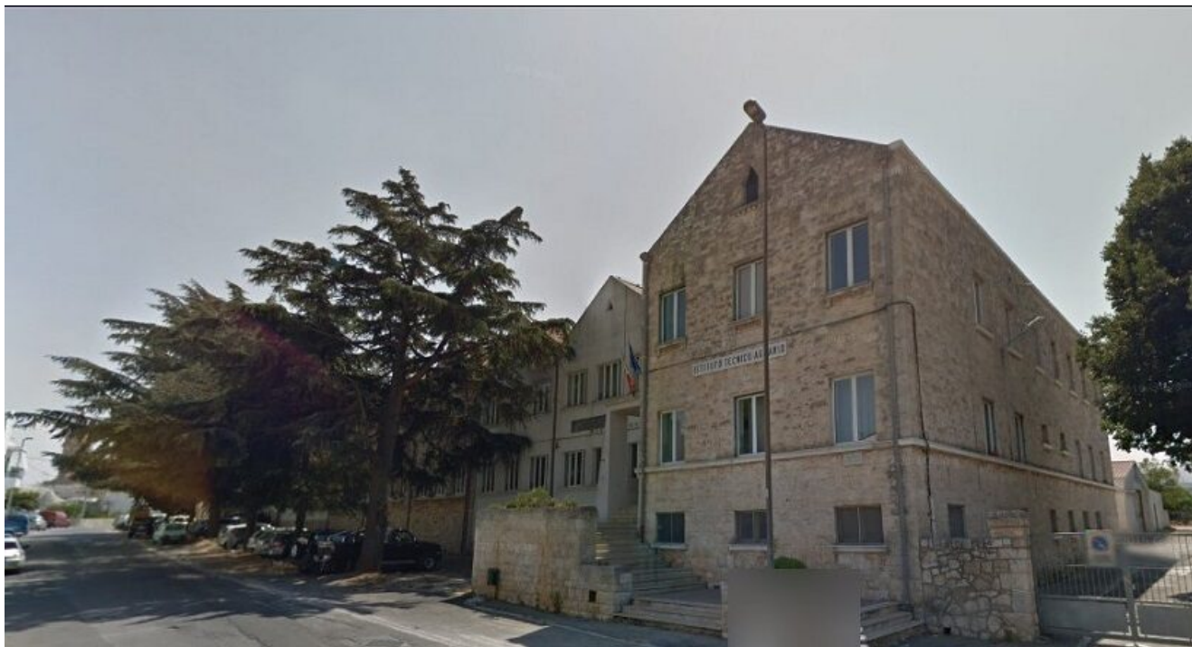
Istituto Tecnico Agrario "F. Gigante" – Alberobello