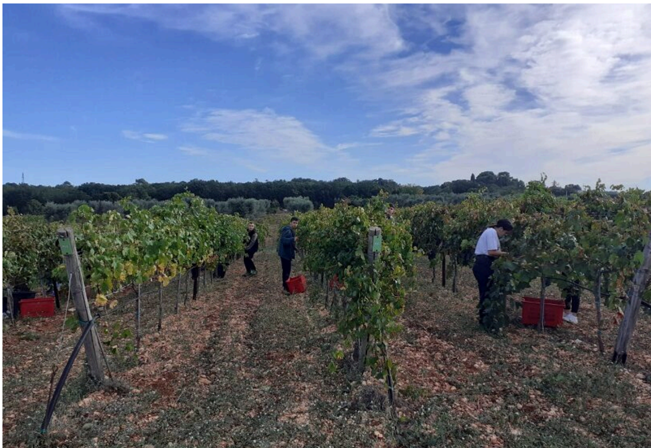
Vendemmia nell'azienda di Locorotondo

L' azienda di Alberobello comprende un complesso zootecnico del 1962, ubicato nei pressi dell'Istituto, un Caseificio del 1965, che opera nell'area dello stesso centro, 5 ettari di terreno in contrada "Cielo Cielo", e 26 ettari in contrada "Albero della Croce", di cui 8 ettari investiti ad oliveto specializzato, 1 ettaro a frutteto e 17 ettari a seminativo. L'azienda, come già detto, dispone di un moderno oleificio didattico-sperimentale.