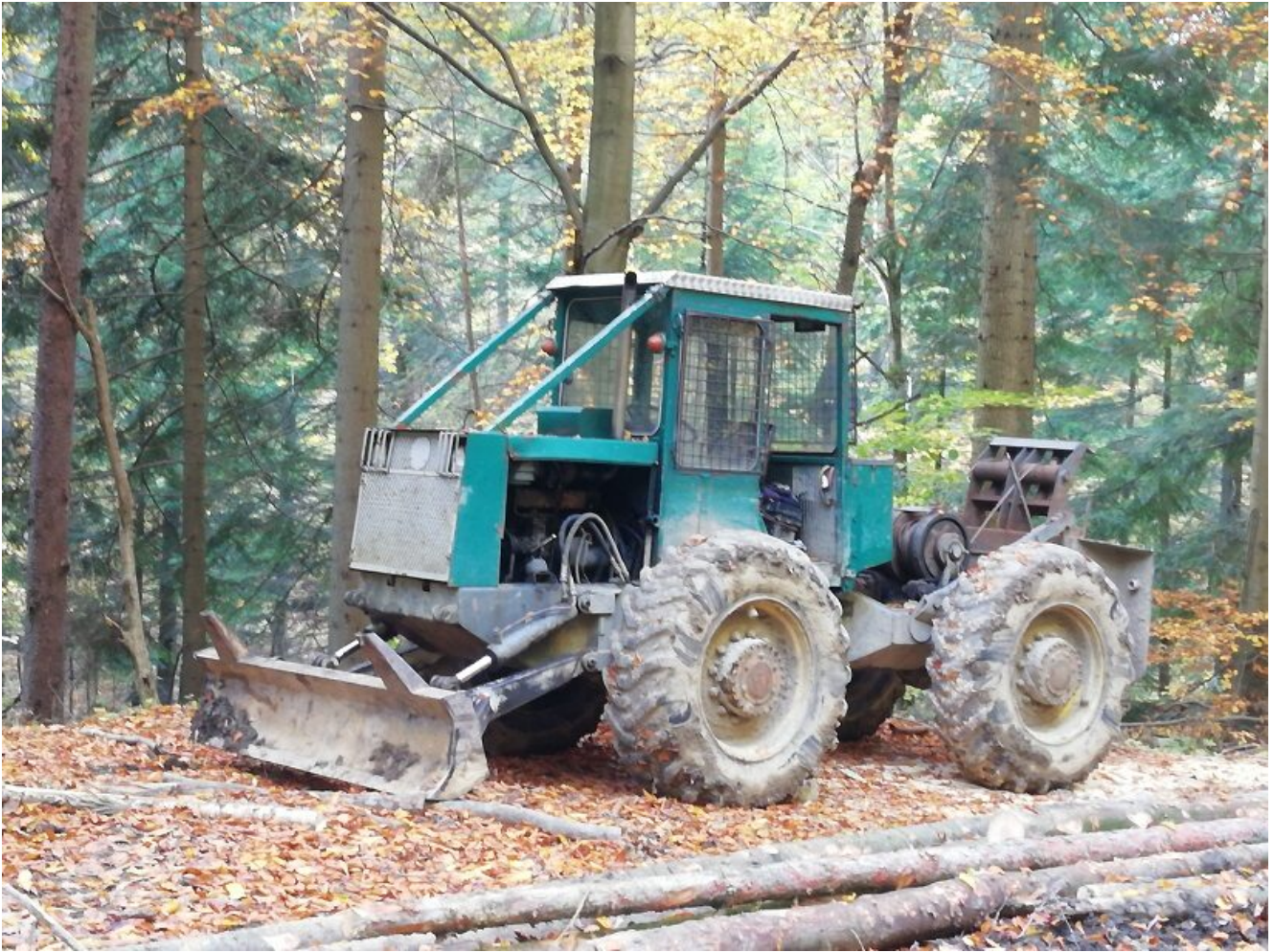
Fig.2: trattore forestale (skidder) munito di verricello, sistema utilizzato per esbosco tramite skidding.