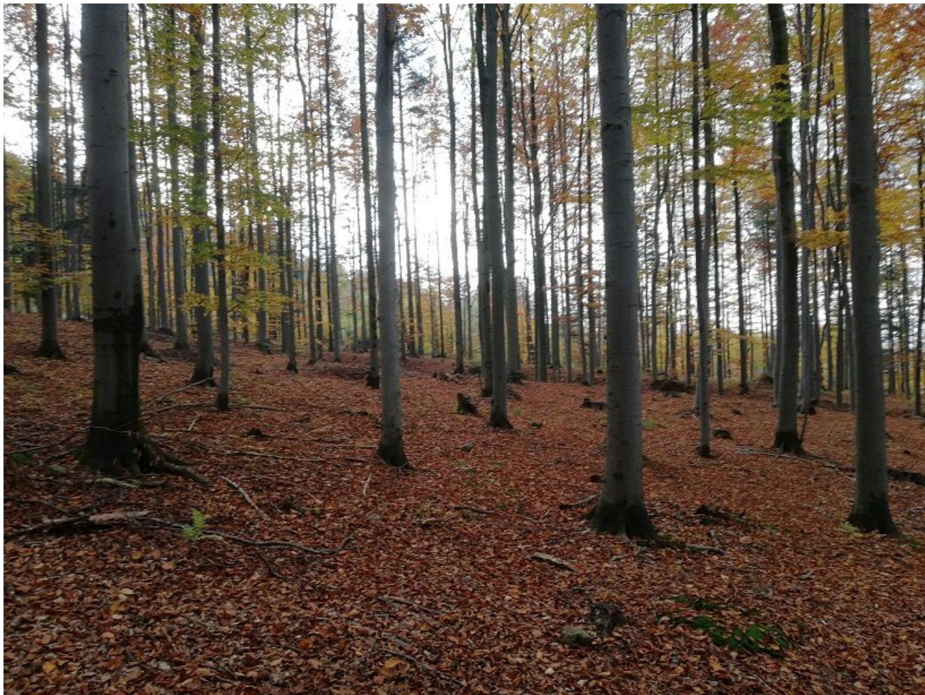
Fustaia di Faggio

written by Rivista di Agraria.org | 15 febbraio 2023