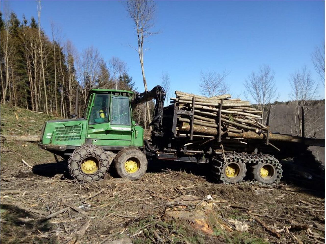
Fig.3: trattore forestale articolato portante (forwarder), sistema utilizzato per esbosco tramite forwarding (Foto: Francesco Latterini).