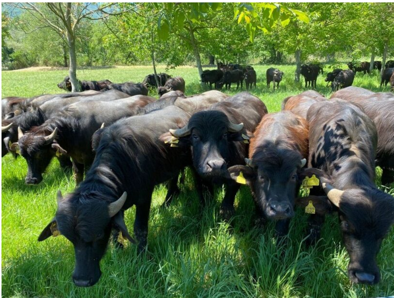
Mandria di bufale di razza Mediterranea Italiana al pascolo

written by Rivista di Agraria.org | 15 aprile 2022 di Gennaro Pisciotta