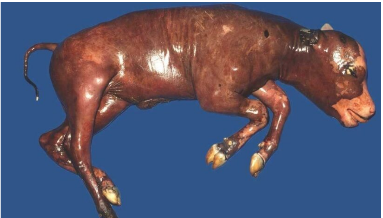
Aborti dovuti a Brucella abortus , si verificano nella seconda metà della gravidanza

Gli animali infetti diffondono la brucella tramite l'aborto o il feto, i liquidi e gli involgi fetali, ma anche attraverso il colostro ed il latte, di conseguenza è obbligatorio denunciare casi di brucellosi al fine di tutelare la sanità pubblica e le attività economiche nelle aree agricolo-pastorali interessate.