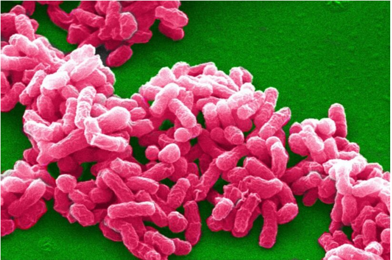
B. abortus