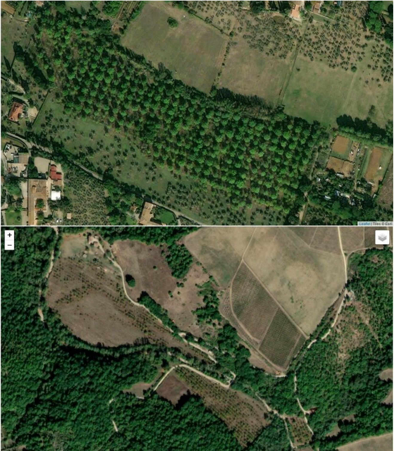
Ecco un impianto puro di ciliegio reso irriconoscibile dal passaggio di un incendio boschivo; la carta dell'uso del suolo lo classifica frutteto 222, nel 2007 la foto aerea CGR lo ritraeva fiorito.