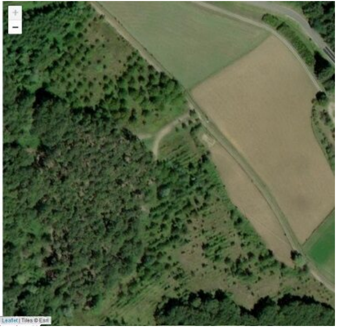
Ecco un impianto misto ben riuscito e uno non riuscito