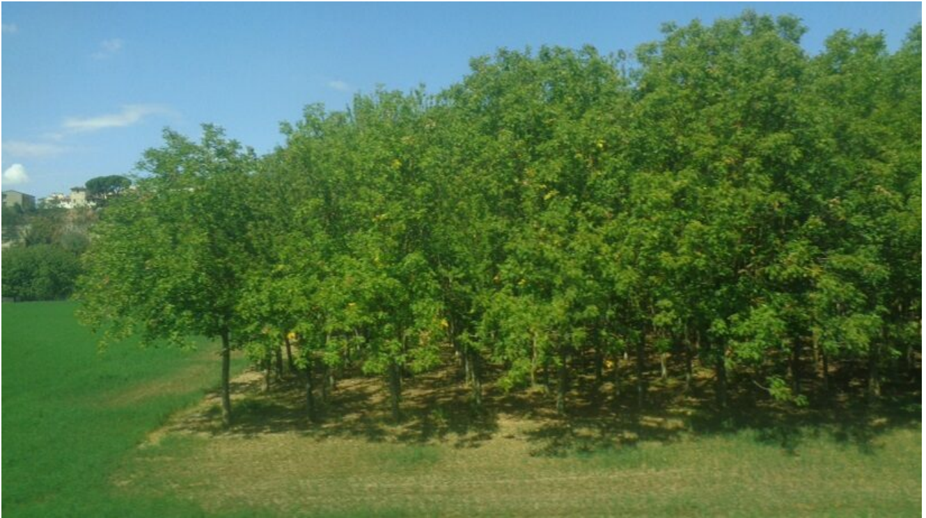
Ciliegio e noce di trent'anni con gestione troppo zelante del sottobosco

La regimazione delle acque migliorata e la mitigazione degli eccessi climatici sono effetti proporzionali alla copertura ottenuta, non sempre colma nemmeno trent'anni dopo l'impianto.