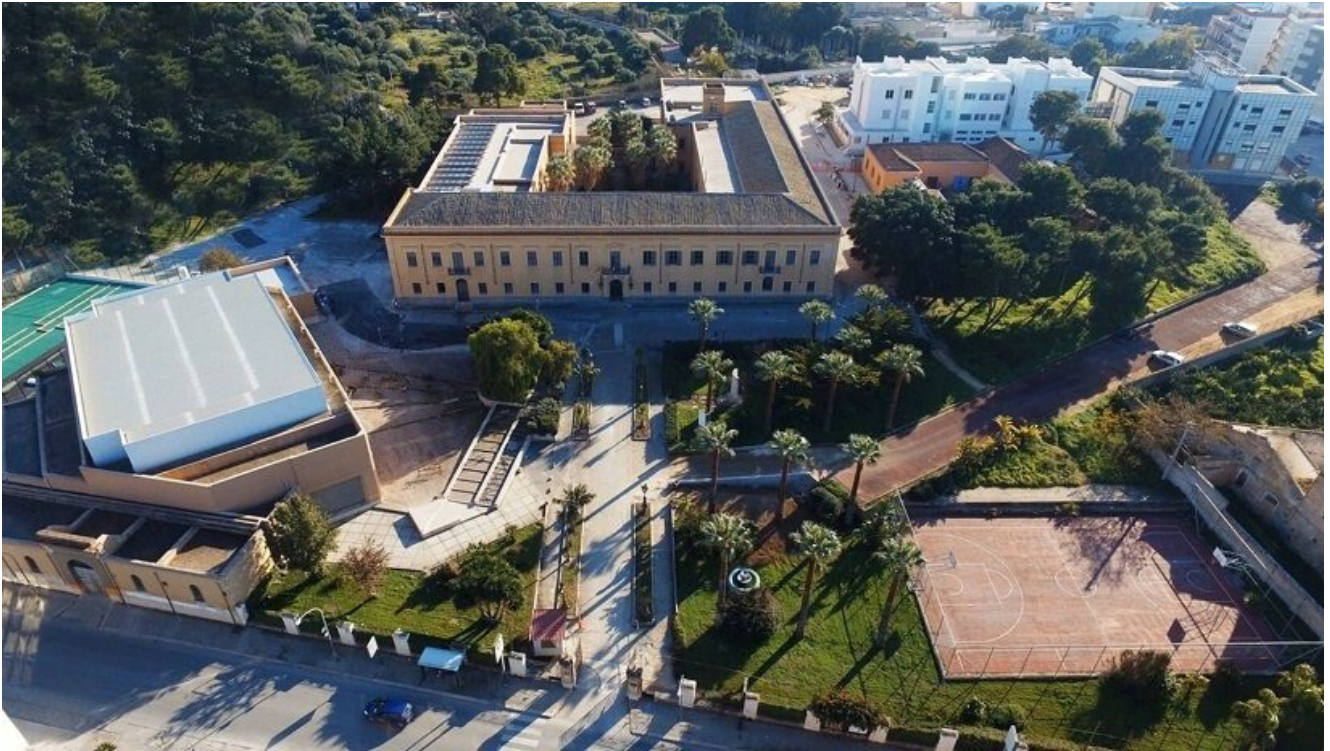
Istituto Tecnico Agrario Statale “Abele Damiani”

written by Rivista di Agraria.org | 14 novembre 2022