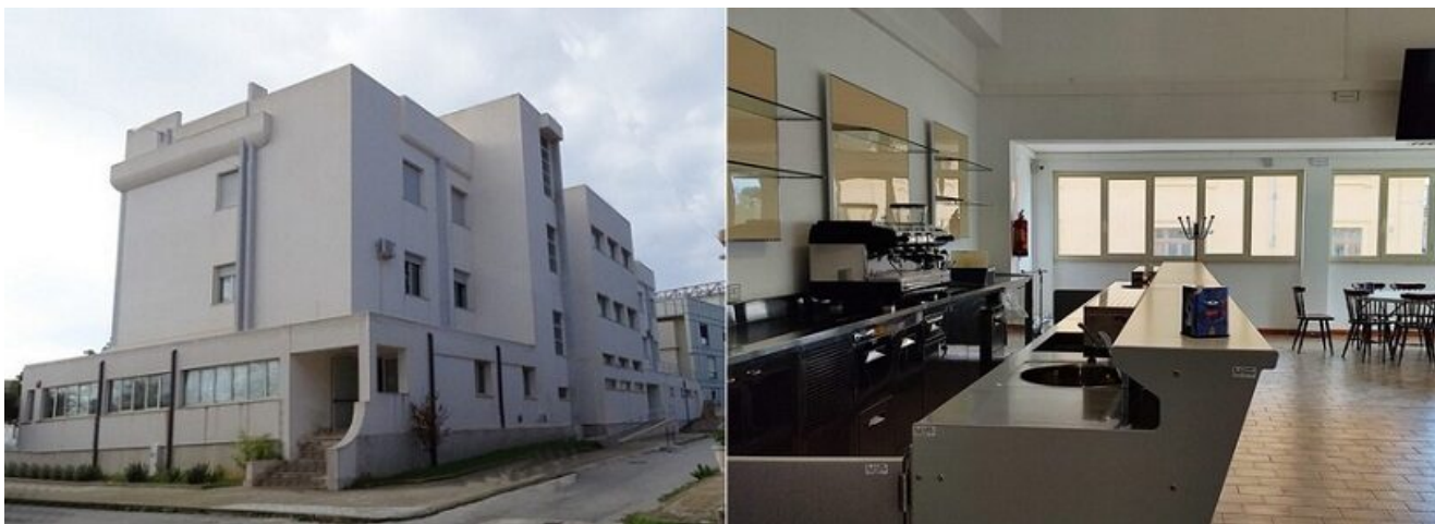
Il convitto dell'Istituto "Damiani"

Dall'anno scolastico 2020/21 la struttura è disponibile ad accogliere anche studenti semiconvittori, sia interni che esterni, che desiderano fermarsi per il pranzo e per lo studio pomeridiano.