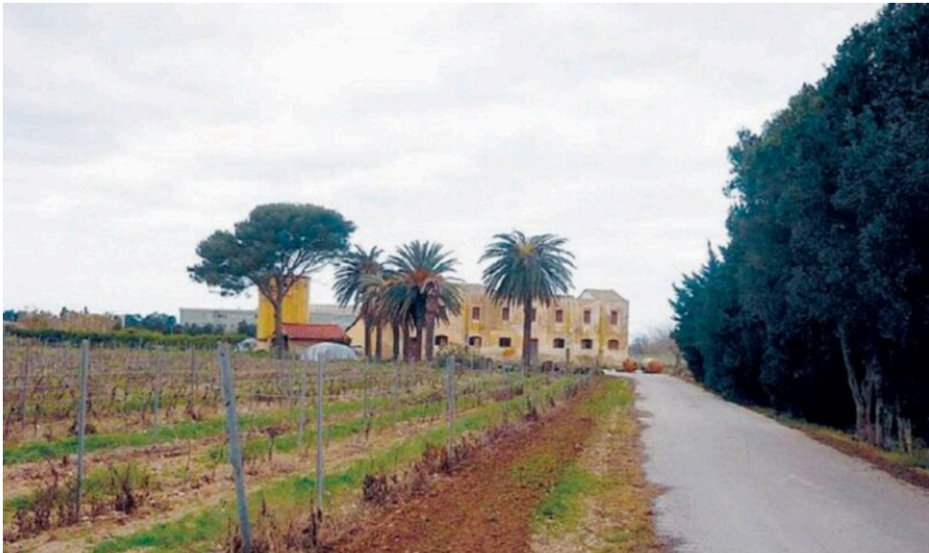
Il podere "Badia"