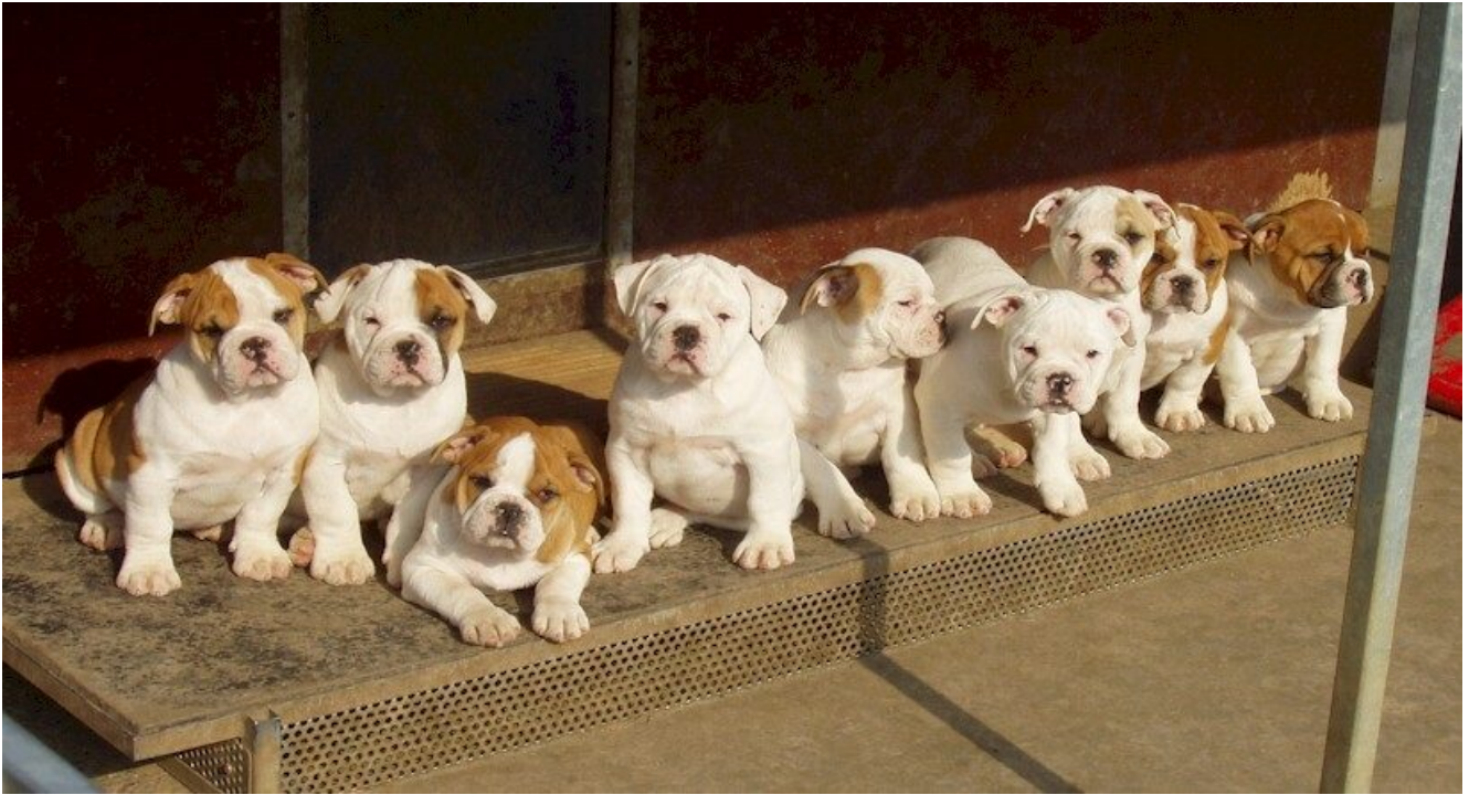
Cucciolata di Continental Bulldog