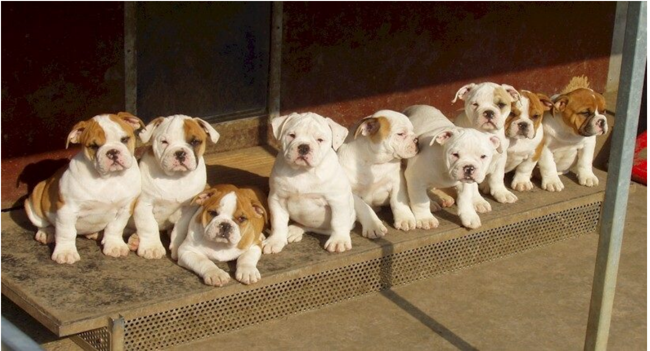
Cucciolata di Continental Bulldog