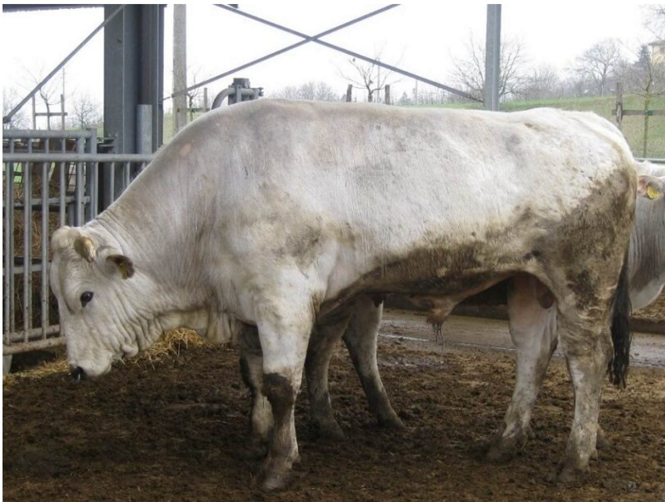
Soggetto maschio giovane di razza Chianina

Il miglioramento genetico della razza ebbe inizio nella metà dell'800 ad opera di privati allevatori, impulso lo diedero le famiglie Bastogi e Frassineto . La selezione era massale, ossia fenotipica, svolta dai fattori a vista, infatti, la scelta dei vitelli da rimonta e successivamente quella dei tori e delle giovenche venivano effettuate dai coloni più appassionati dell'allevamento registrando i dati più significativi sul "registro del bestiame" dal quale si potevano desumere le genealogie dei tori e delle vacche nati in fattoria i cui vitelli venivano venduti o scambiati con quelli di altre aziende di buona reputazione allo scopo di correggere difetti o migliorare le caratteristiche come la mole, lo sviluppo degli arti, il mantello bianco con la pigmentazione del musello e del nappo della coda.