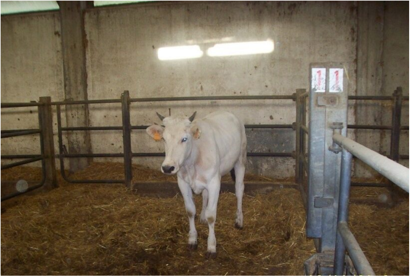
Manzetta di razza Chianina- Cooperativa Il Forteto – Vicchio Firenze

Ma il vero impulso al miglioramento genetico della razza si ebbe a partire dal 1932 ove furono messi a punto i criteri della selezione esaltando maggiormente il carattere carne a scapito dei caratteri per il lavoro, fu così che l'Ispettorato Agrario per la Toscana e l'istituto zootecnico di Firenze diretto dal prof. Giuliani gettarono le basi per la istituzione del libro genealogico della razza, il rilievo delle misure somatiche, il controllo del peso vivo, il genotipo e il punteggio sulla conformazione furono demandati ad esperti, a tecnici degli ispettorati provinciali dell'agricoltura, ai quali venne affidata l'organizzazione della selezione.