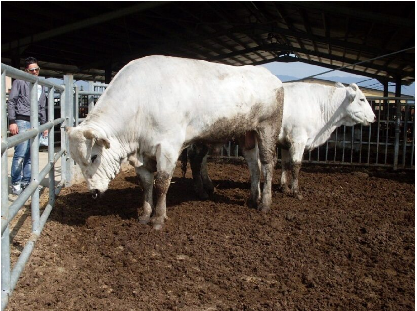
Az. Valdastra di Adriano Borgioli - Borgo San Lorenzo Firenze - Toro e vacca di razza Chianina

Successivamente il libro genealogico passò dalla gestione ministeriale a quella dell'associazione nazionale allevatori e nel 1961 fu costituita l'ANABIC (il centro genetico si trova a S. Martino (PG) che coordina l'attività dei libri genealogici delle razze Chianina, Romagnola, Marchigiana, Maremmana e Podolica finalizzando il miglioramento genetico sulla precocità di sviluppo sulle caratteristiche di conformazione e sulla quantità e qualità della carne.