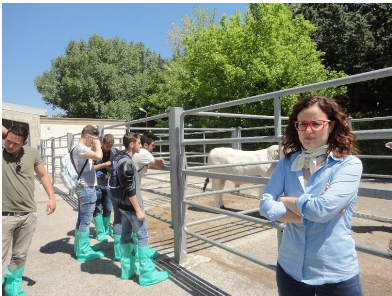
ANABIC S. Martino Perugia