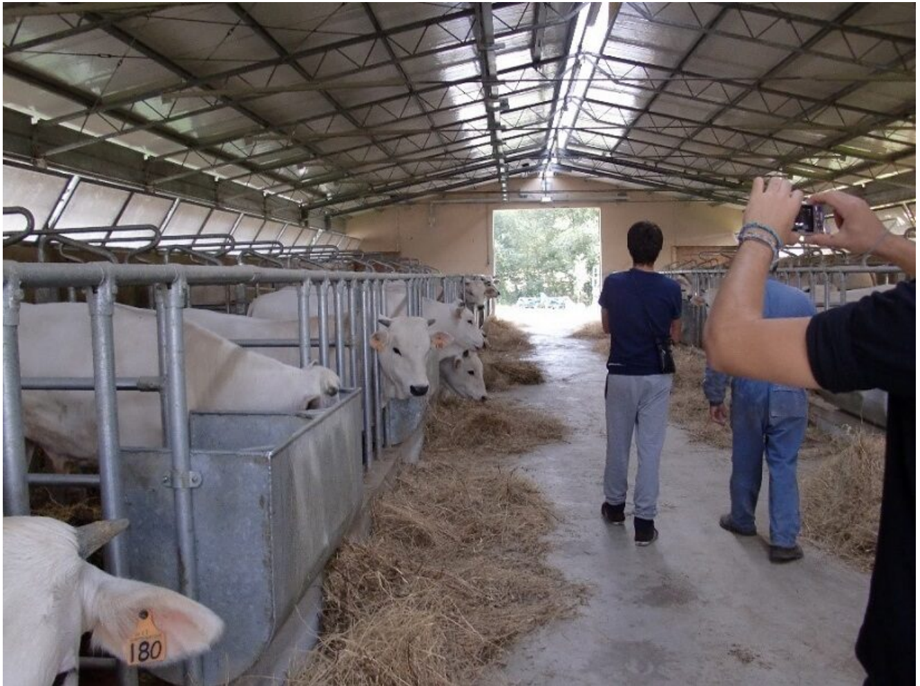
Cooperativa Il Forteto - Vicchio Firenze

esposizione fu istituito anche un confronto della Chianina con la Romagnola. Dopo il primo conflitto mondiale, negli anni '20, fu ripreso il lavoro di miglioramento genetico della razza, furono organizzate le mostre-concorso di cui la prima nel 1922 a Montepulciano (SI) che insieme alla mostra di Arezzo erano le due principali piazze per il confronto e scambio di animali tra gli allevatori, oggi la rassegna più importante della razza si tiene a Bastia Umbra (PG).