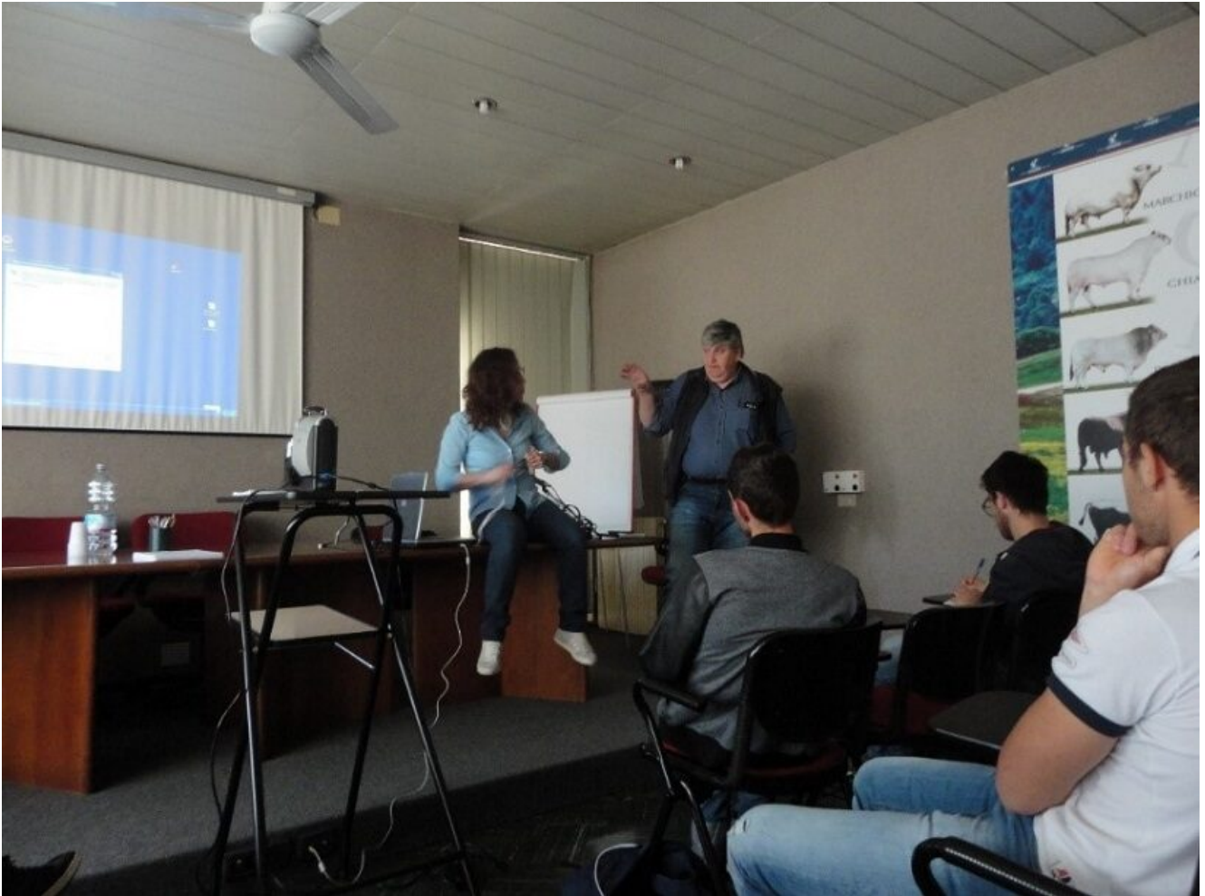
ANABIC S. Martino Perugia