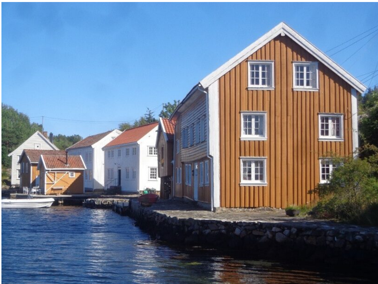
Paesaggio culturale a Svinør, Agder, Norvegia

col cessare della transumanza, l'uso del suolo è radicalmente cambiato, sono coltivati a livello amatoriale solo piccoli orti e giardini e la maggior parte della brughiera è stata rimboschita con conifere esotiche.