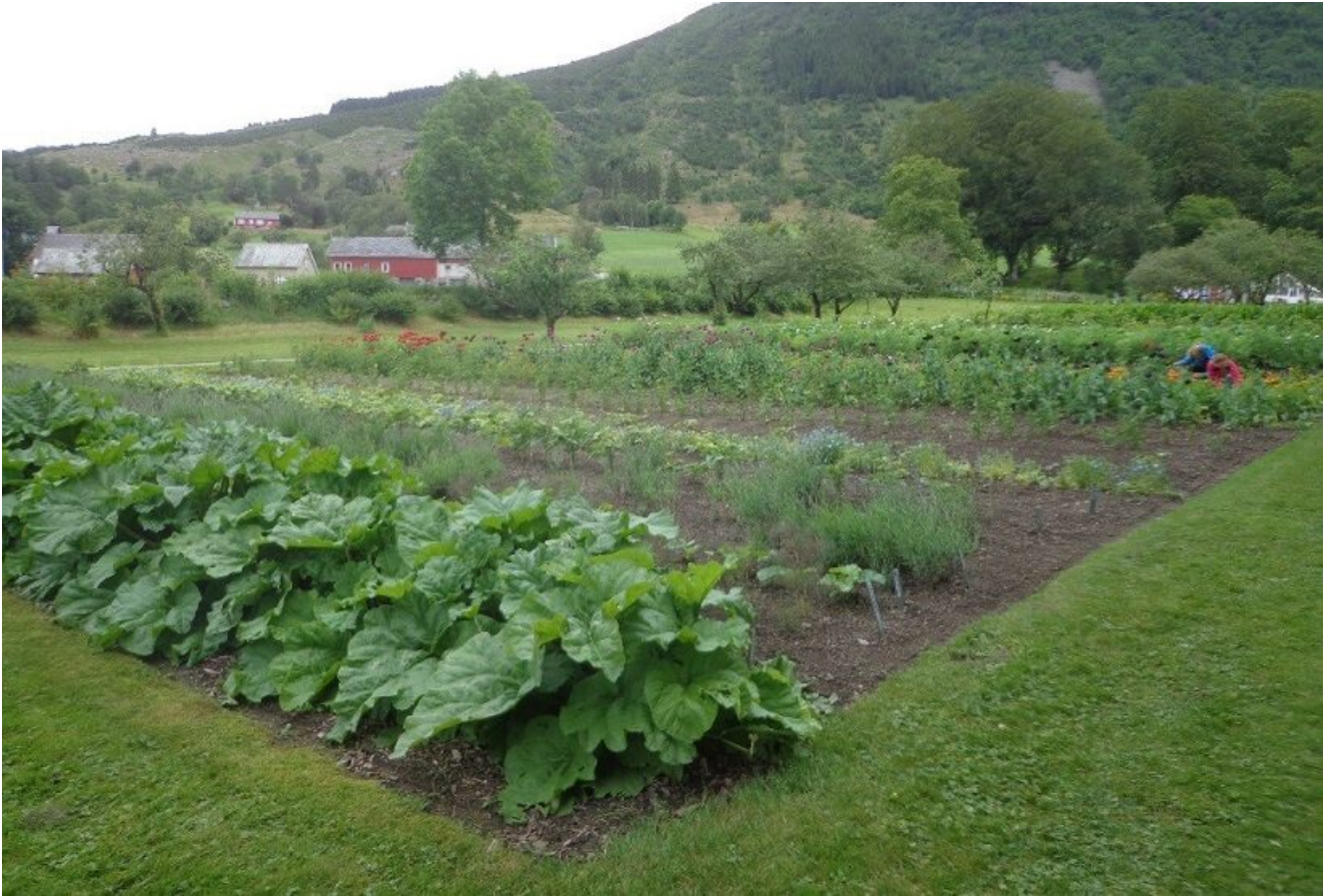
Policoltura nella Baronía di Rosendal, Vestland, Norvegia