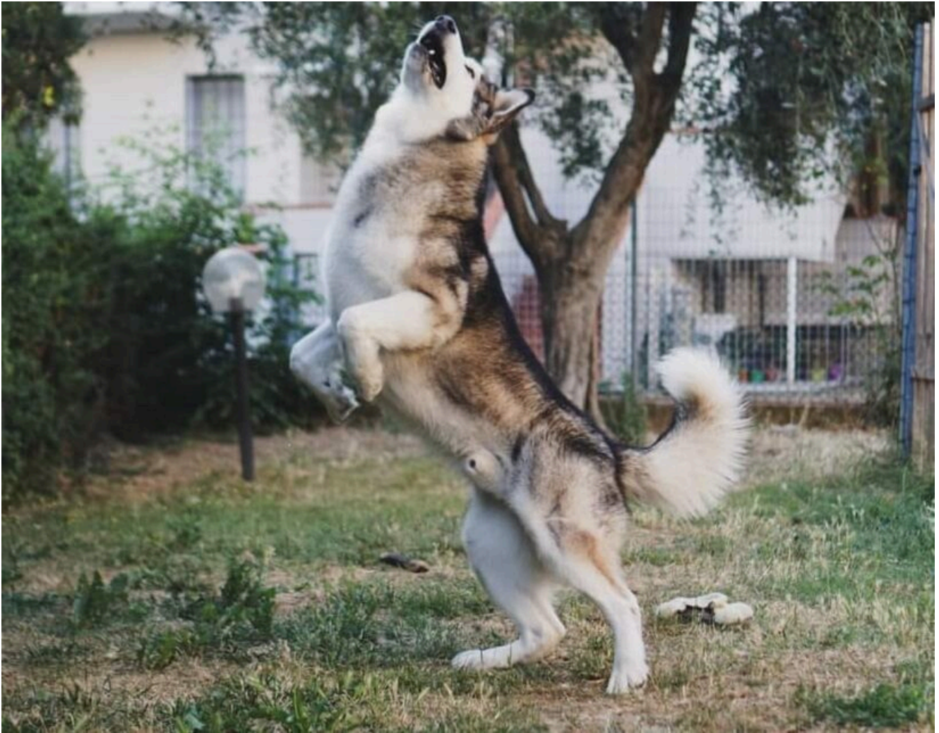
“Thunderball del Lago degli Orsi”, soggetto di grande atleticità

Tenendo presente la sommatoria di questi quattro aspetti, possiamo definire il grado di qualità di una selezione, quindi di un allevamento.