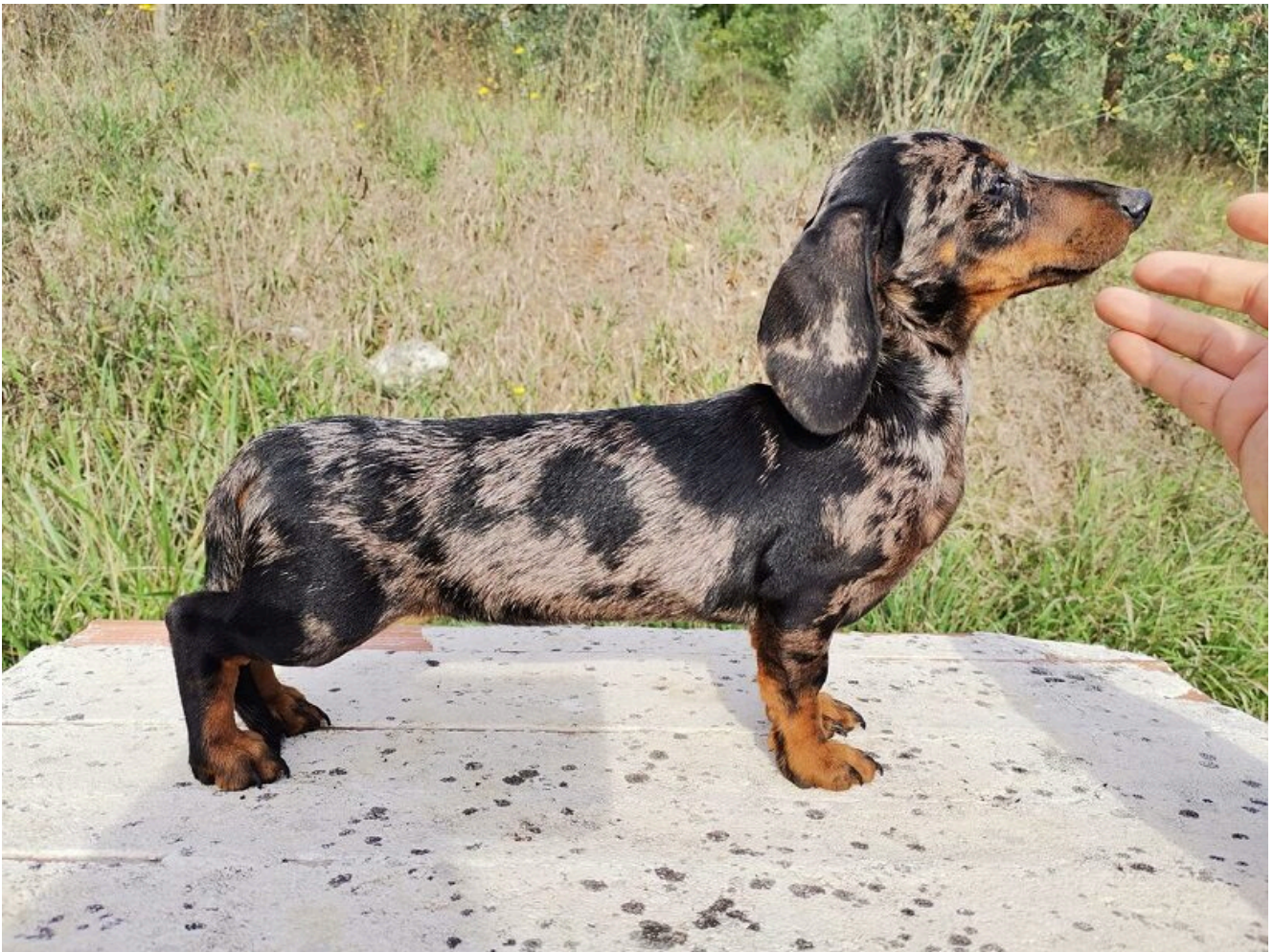
Cucciola di Bassotto kaninchen, “Volschidachs Mandorla”, 4 mesi di età

written by Rivista di Agraria.org | 30 novembre 2021 di Federico Vinattieri