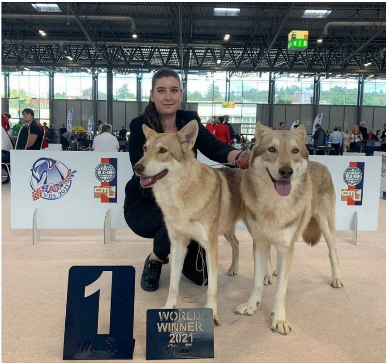
Coppia di Cani Lupo di Saarloos

Possiamo quindi dire che la “qualità di un allevamento” è l’insieme delle sue caratteristiche intrinseche ed estrinseche.