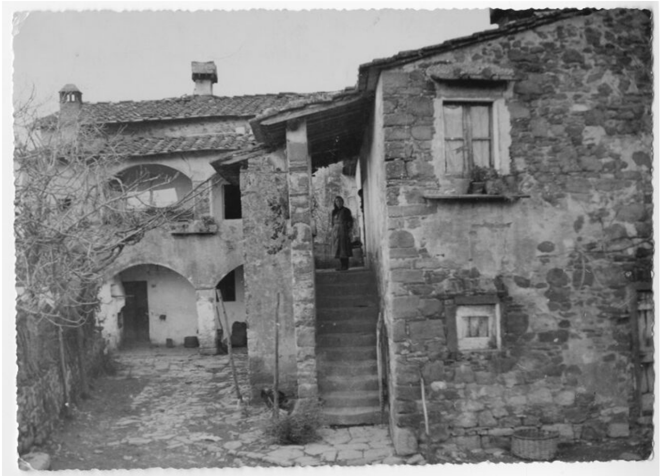
Casa colonica leopoldina e successiva aggiunta