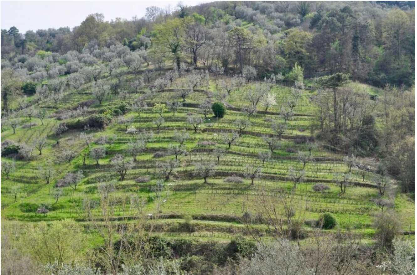
Residuo attuale dell'alberata toscana