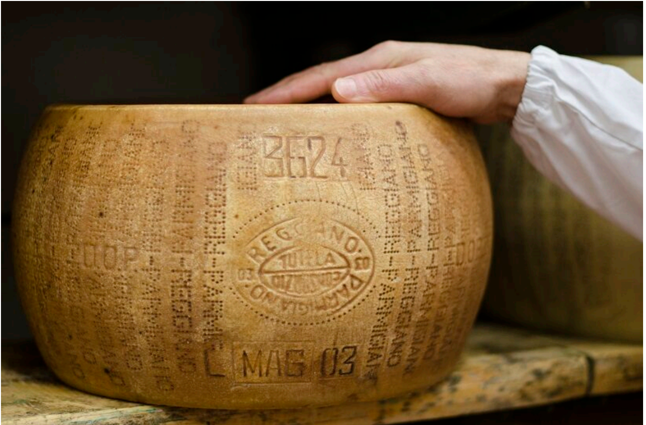
Parmigiano Reggiano Dop

Se si considera invece la DOP Prosciutto di Parma, la zona di produzione comprende il territorio della provincia di Parma posto a Sud della via Emilia distanza da questa non inferiore a 5 chilometri fino ad una altitudine non superiore a 900 metri, delimitato ad est dal corso del fiume Enza e ad Ovest dal corso del torrente Stirone. Ma la materia prima proviene da un'area geograficamente più ampia della zona di trasformazione, e comprende il territorio amministrativo delle Regioni Emilia Romagna, Veneto, Lombardia, Piemonte, Molise, Umbria, Toscana, Marche, Abruzzo e Lazio.