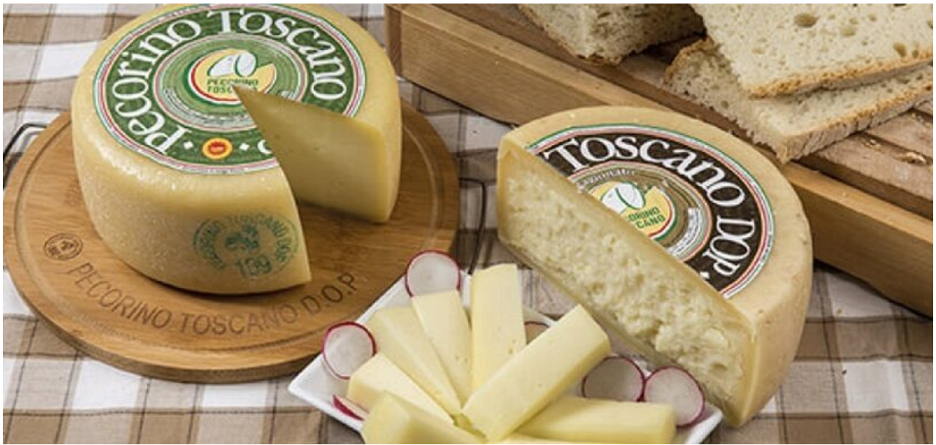
Pecorino Toscano DOP

essere spiegato nel dettaglio, in modo da comprenderlo anche senza essere presente visivamente nel disciplinare, indicando i colori che lo compongono e addirittura le percentuali di colore per ricrearlo.