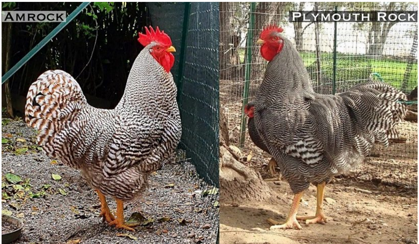
a sx: Gallo Amrock (all.to A. Cosentino), a dx: Gallo Plymouth Rock

Ma prima di affrontare gli svariati attributi morfologici che fanno sì che queste tre razze abbiano una loro unicità, spendiamo poche righe per descriverne le analogie.