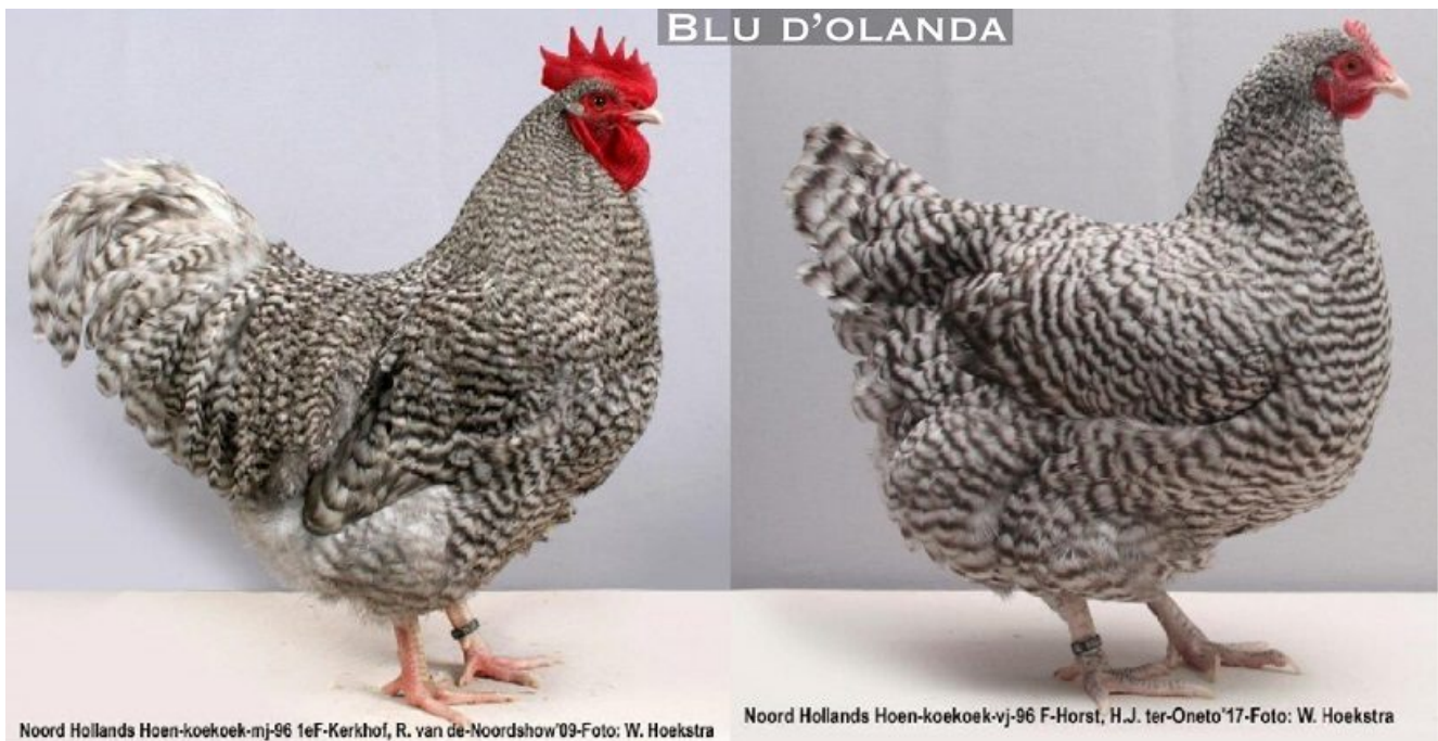
Pollo dell'Olanda del Nord, Gallo e Gallina

Razza oggi più famosa e a mio avviso anche molto più elegante della sua ormai lontana parente.