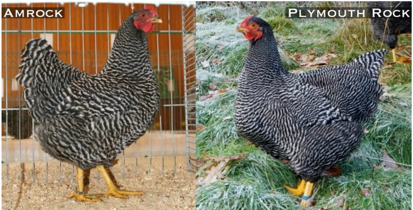
a sx: Gallina Amrock (all.to F. Vinattieri), a dx: Gallina Plymouth (J. Kemp 2013 theplymouthrockclub.co.uk )

Avvalendomi dei tre standard ufficiali di razza, mi accingo ad analizzare i connotati specifici di queste tre razze.