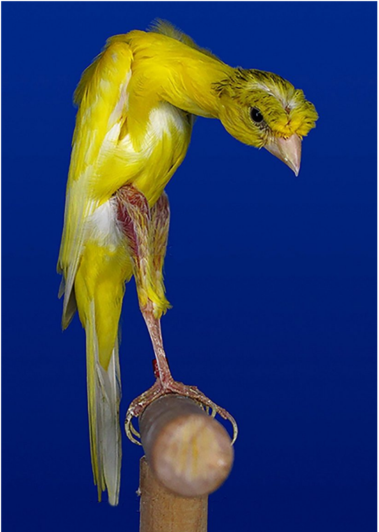
Giraldillo Sevillano in posizione

Come abbiamo fatto per il Benacus, vediamo più nello specifico le caratteristiche fondamentali che distinguono