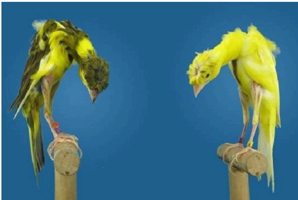
Due esemplari di razza Giraldillo Sevillano

Il suo nome è preso dalla banderuola che incorona la torre "Giralda" della cattedrale della città di Siviglia. La sua forma infatti è quella del Gibboso spagnolo in miniatura.